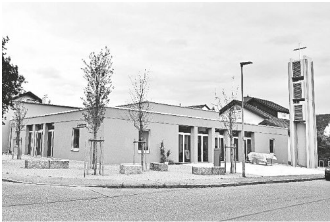
So sieht's aus: unser neues Gemeindezentrum und die Kirche jetzt