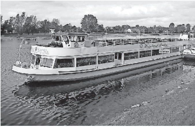
„Weinland Baden“ am Anleger Breisach am Rhein