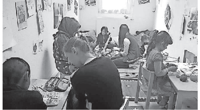
Spielen und malen in der Kinderstube

Gerne können Sie den Helferkreis auch begleiten, wenn zum Beispiel die Gruppe Erstkontakt, die Flüchtlinge in der Unterkunft besucht. Herzlich eingeladen sind Sie auch zur Café/Tee-Stube, die einmal im Monat stattfindet oder helfen Sie bei der Kleiderkammer, der Kinderbetreuung, oder in einer der anderen Arbeitsgruppen mit.