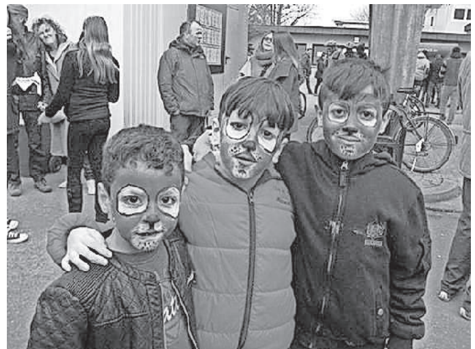
Glückliche geschminkte Kinder