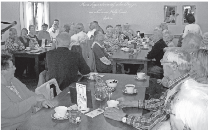
Hofgut Zeisset in Weisweil