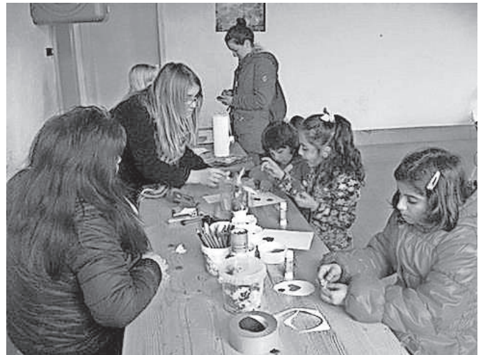
Basteln mit den Kindern am Frühlingsbegegnungsfest