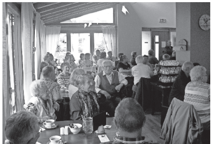
Zwischenstopp in Kiechlinsbergen